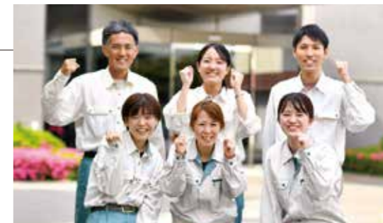
総務人事部 人事グループ 採用担当

当社は一貫したモノづくりと安定した給与や休日などの待遇で、安心して長く働ける環境を整えています。モノづくりの楽しさや達成感を仲間と分かち合いながら、着実に成長できる会社です。保護者の皆様にもご安心いただけるよう、教育やサポート体制も充実しています。皆さんと一緒に未来を築ける日を心より楽しみにしています!